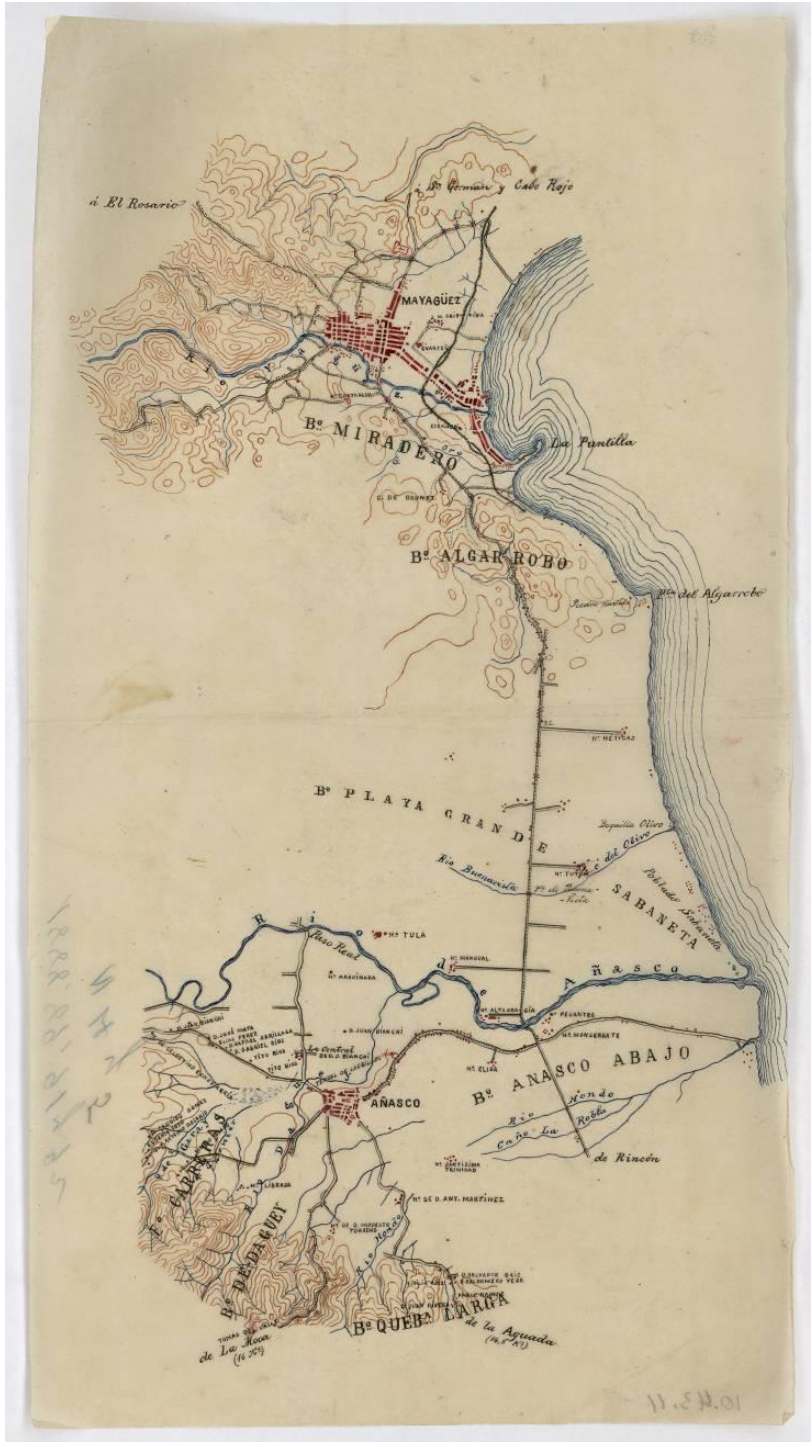
Figura 2: Mapa#2 Añasco a Mayagüez